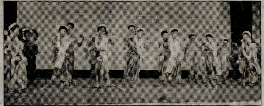
रंगारंग कार्यक्रम की प्रस्तुति देते बच्चे।